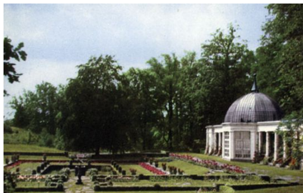
Orangeriet . Privat bild.

År 1914 byggdes det gamla växthuset från 1860-talet om till ett nyklassiskt orangeri. Clason ritade efter Theodor Adelswårds skisser. Endast mittkupolen behölls och denna utgör nu kupolen i Rotundan. Därefter påbörjades planerna på en sunken garden framför Rotundan. Ester Claesson, en av de kvinnliga pionjörerna inom trädgårdskonst, hade redan 1913 skickat förslag på en sunken garden till Adelswård. I Sverige fanns ingen liknande anläggning vid denna tidpunkt och I.G. Clason anställde Ester för att ta fram ritningar. Samarbetet mynnade ut i en sunken garden framför Rotundan, där till kom en absidial rosenträdgård som Rudolf Abelin förslagit. Ester Claesson ritade några år senare även en örtagård till Adelsnäs köksträdgård. Det är en fin liten anläggning i kvarter med skifferplattor och solvisare. Buxbomshäckar och perenner är planterade efter noggranna skisser där form och färg har stor betydelse. Influenserna från Gertrude Jekyll syns tydligt. Även ett storslaget förslag till terrasser ned mot vattnet framför huvudbyggnaden med murar, damm, paviljonger, klippta idegranshäckar ritades av Clason. Förslaget utfördes aldrig men visar ambitionen och också kunskapen om typiska Arts and Craft uttryck.