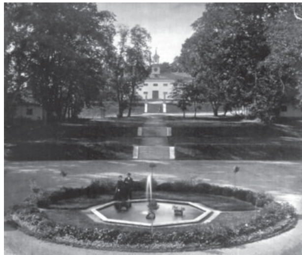
Parterren på Adelsnäs. Vy upp mot magasinet, ca 1870.

Den engelska parken på Adelsnäs kom slutligen att utgöra hela halvön med stränder och öar, med många gångsystem och ett otal utflyktsmål. En detaljerad plan från 1879 visar dess slutliga omfattning. Parken hade sin storhetstid under 1830- och 1840-tal sedan en holländsk trädgårdsmästare, van der Kodde, anstälts för att sköta anläggningen. Kostnaden och underhållet av parken krävde varje år stora summor och många händer. Parken och trädgårdens huvudsakliga funktion under denna tid var till nöje och dekoration, men skulle också ge status till ägarna. Under 1850-talet besökte de kungliga prinsarna Carl och Oscar Adelsnäs parkanläggning. Parken hade inga krav på sig att vara ekonomiskt bärande, men de fruktträdgårdar som fram till 1860-talet anlades producerade varor för gårdens hushållning. Fruktträdgårdarna fick således en dubbel funktion, dels dekorativ och dels produktiv. De resterande delarna av anläggningen; lustträdgården och parken var generellt sett endast till för herrskapet. I parken och vinterträdgården ordnades sällskapslekar och kostymfester. Ett nytt växthus i glas uppfördes på 1860-talet och var ett exempel på den nya teknik med glasbyggnader som vuxit fram i England. Trots nysatsningen på uppväxmt växthus förföll Adelsnäs-parken under 1860-1870-talen, ett släktgrensbyte bidrog till det avtynande intresset. Kopparproduktionen gav därtill dålig avkastning och det ekonomiska läget försämrades.