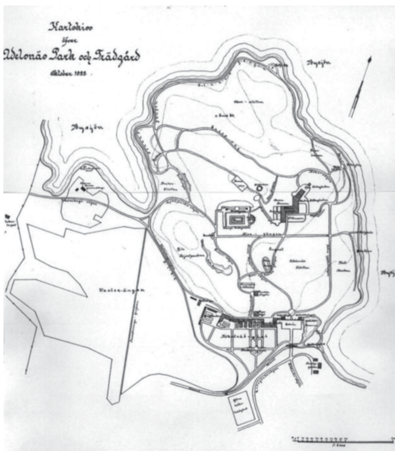
Plan över den färdiga anläggningen från 1922.

En trädgård kan man icke låra känna genom beskrivning, den bör ses, och till Adelsnäs trädgård läro alla trädgårdsintresserade välkomna.