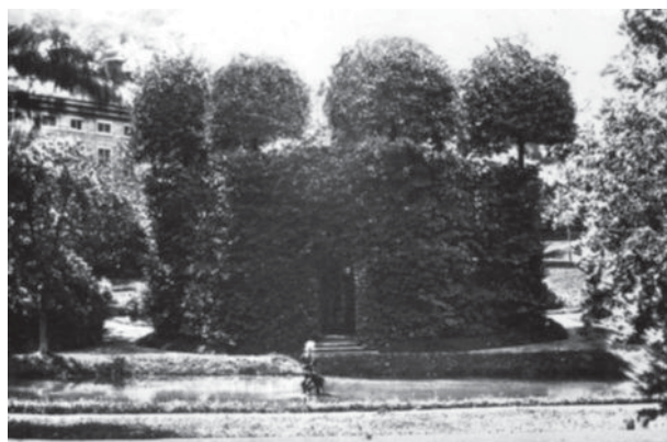
Linnétemplet på Adelsnäs under 1870-talet.

Klocksträdgården var uppbyggd i sex kvarter med grusgångar och kantade med långa rader av spaljerade fruktträd. Den var lokaliserad ned mot vattnet och där fanns även springbrunnar, lekstuga, uppstoppade pöfglar, olika växthus samt exotiska växter. Det så kallade Lugnet utgjorde en avgränsad lustträdgård nära huvudbyggnaden med klippta träd och buskar, gångar och lustiga ornament. Linnétemplet var en komplicerad formation av klippta lindar med klättrande kaprifol. Bakom Linnétemplet låg en målad drake och strax intill fanns ett trädhus för kaffestunder. I dammen sprutade fyra skulpterade