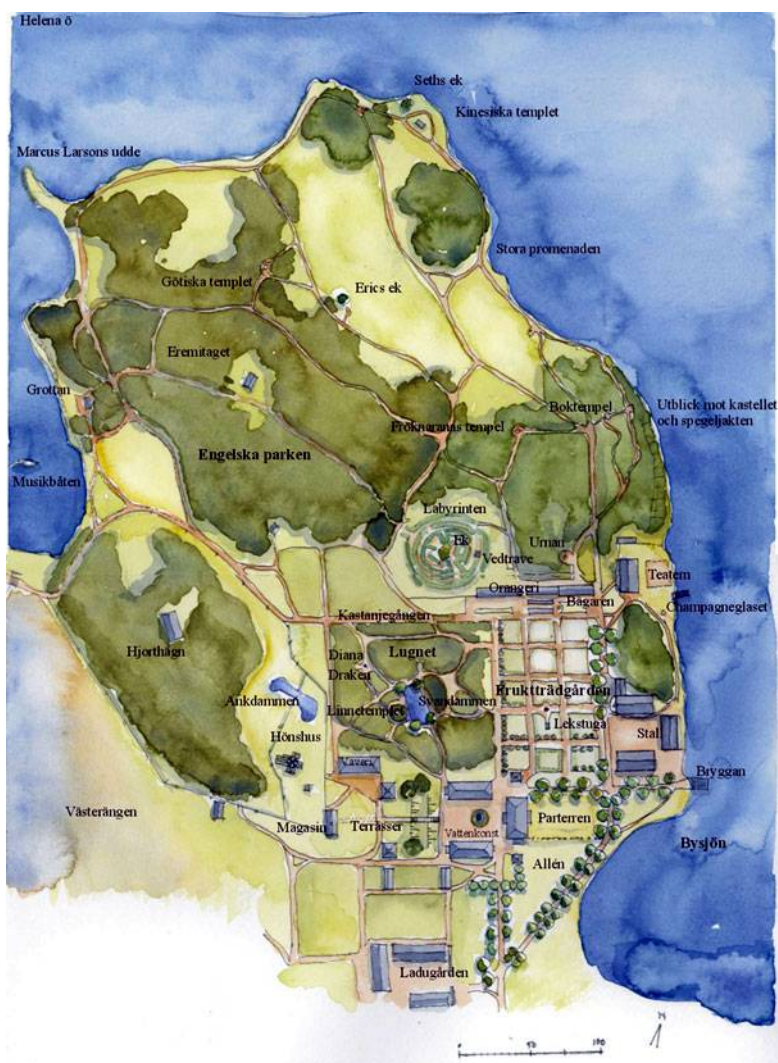
En översikt över Adelsns halvö och den engelska parken under 1800-talet. Fritt efter 1890-tals karta. Akvarell Anna Lindell

Baroniets kopparproduktion gav stor avkastning, särskilt mot 1800-talets mitt och mot denna bakgrund hade man kunnat förvänta sig att en ny och mer påkostad herrgårdsbyggnad skulle ha uppförts på Adelsns. Det skedde dock inte men kanske fanns det sådana planer som aldrig genomfördes? Istället intresserade man sig för parkanläggningens fridigställe. En engelsk park med bland annat lusthus, tempel och slingrande gångar anlades och byggdes ut